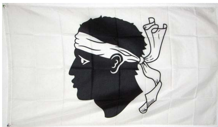
Bild4: Flagge von Korsika

Doch nicht nur die Musik erlebte einen Aufschwung. Auch die Sprache bekam neue Farbe. Da nun plötzlich wieder so viel gesungen und gedichtet wurde, konnte sich auch das schon fast erstarrte Korsisch wieder entwickeln und wurde zu einer lebendigen Sprache. Grosseltern, die ihren eigenen Kindern das Korsisch nicht beigebracht hatten, begannen mit ihren Enkeln ihre eigentliche Sprache zu reden und bewahrten sie so vor dem Aussterben. Heute hat Korsika eine blühende Kulturszene. Man ist stolz, Korse zu sein und einer Kultur anzugehören. Dies ist eine sehr wichtige Voraussetzung für eine dauerhaft friedliche Lösung mit Frankreich. Denn nur wer seinen Wurzeln kennt und diese anerkannt weiss, ist zu einem Kompromiss und zum Frieden bereit.