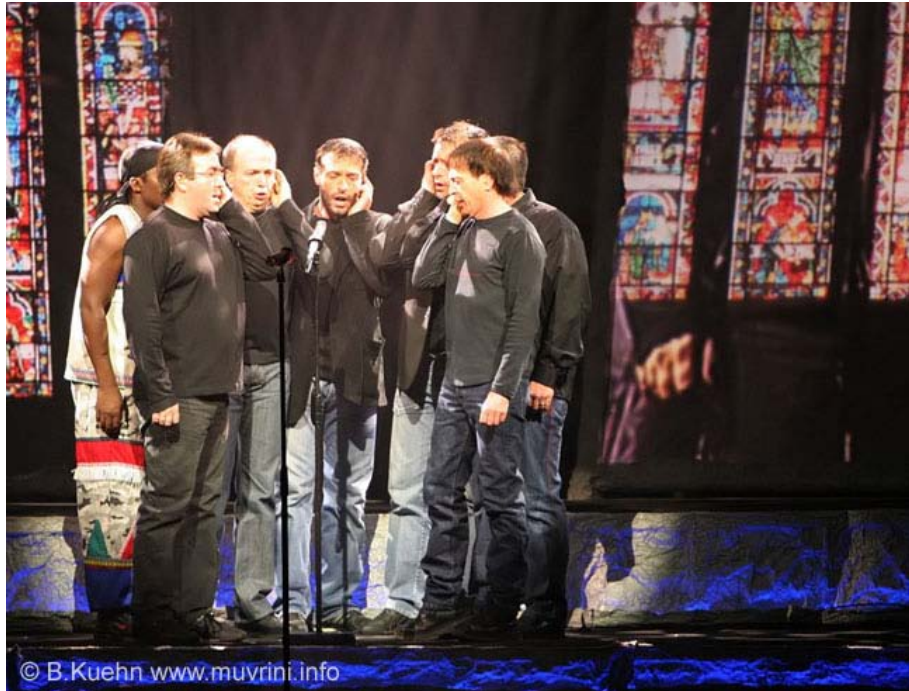
Bild 20 : I Muvrini zusammen mit Sängern aus Südafrika bei einem ihrer jüngsten Konzerte