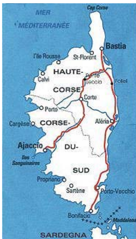
Bild1: Karte von Korsika

Korsische Musik ist geprägt vom Wunsch nach Freiheit und von Liebe zum Vaterland. Es mag für manche seltsam erscheinen, dass die Korsen ein so starkes Nationalbewusstsein und ein so hohes Mass an Patriotismus an den Tag legen. Dieser Umstand ist nur mit der Geschichte der Korsen zu erklären, der Geschichte eines Volkes, das Jahrhunderte lang unterdrückt und seiner Rechte beraubt wurde. Nur wer einen Blick auf die Geschichte Korsikas geworfen hat, kann verstehen, warum dieses Volk so freiheitsliebend ist und jedem mit grösstem Misstrauen begegnet, der ihm diese Freiheit zu nehmen droht. Dies soll in diesem Kapitel getan werden. Mit einem kurzen Überblick über die korsische Geschichte möchte ich Verständnis wecken für den grossen Nationalstolz und die Heimatliebe, welche die Korsen in sich tragen und die somit auch Teil ihrer Musik ist.