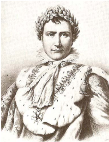
Napoleon Bonaparte 15. August 1769 Ajaccio, Corsica; †5. Mai 1821 St. Helena, Süd-Atlantik

In Ajaccio wird Napoleon Bonaparte geboren