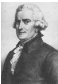
Pasquale Paoli 6. April 1725 Strette ; † 5. Februar 1807

Genua verkauft ihre Rechte Corsicas im Versailles Vertrag für 2 Mio. Lire an Frankreich. Corsica greift erneut zu den Waffen. In dieser Zeit galt folgender Schlachtruf: „Guerra! La libertà o la morte!“, was bedeutet: „Krieg! Freiheit oder Tod!“.